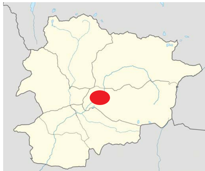
Mapa. Ubicació Encamp.