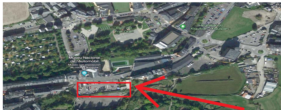
Ortofoto. Entorn parcel·la.