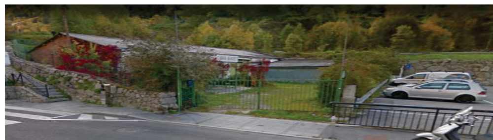
Fotografia. Accés parcel·la per Av. Joan Martí.