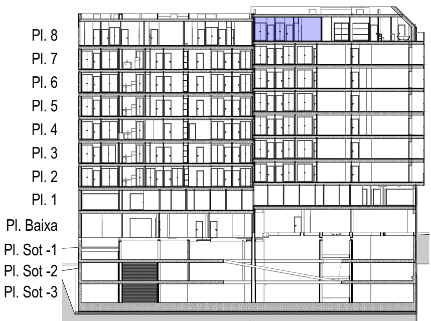
Edifici 1 Edifici 2

Ed2 P18 AP2 (Amb terrassa) Ed2 P18 AP2 (Sense terrassa) SC: 133,31 m 2 SC: 122,85 m 2